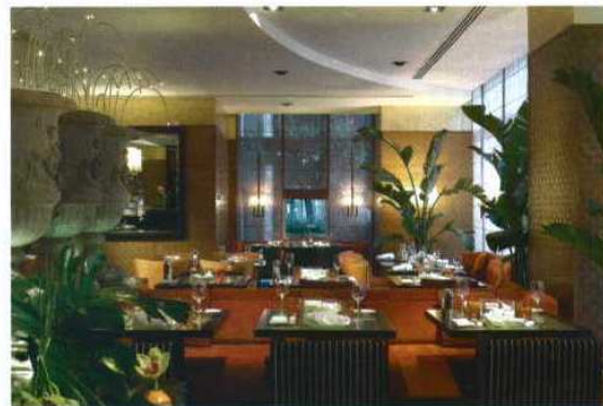
RESTAURANTE ADLIB • O desejado